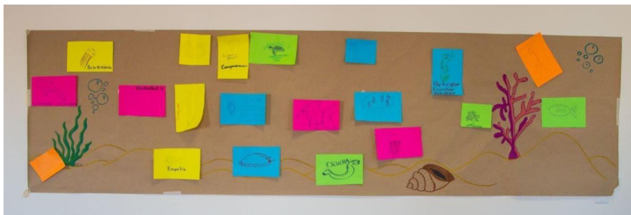
Figura 3. Mural con reglas y valores de Sirenas de México