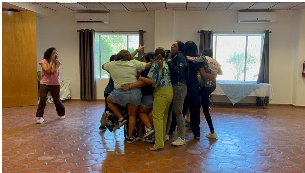
Figura 6. Participantes durante dinámica de comunicación y trabajo en equipo

Con respecto al trabajo colectivo, las Sirenas reflexionaron, por ejemplo, cómo la prisa por resolver los problemas sin escuchar o sin observar al grupo antes puede generar confusión, errores y exclusión de ciertas personas. Al conectar estas experiencias con su trabajo comunitario, las participantes destacaron que el ejercicio refleja la necesidad de observar y escuchar a cada integrante de una comunidad antes de actuar, reconociendo sus diferentes formas de pensar, liderar y aportar. Además, las participantes resaltaron el valor de escucharse, confiar y dejarse guiarse mutuamente, practicando sus habilidades de comunicación no verbal, una habilidad que les resulta familiar como buzas, acostumbradas a coordinarse bajo el agua sin palabras. También reconocieron la importancia de planear juntas, adaptarse a los errores y aprender de ellos, soltar la perfección, delegar y relajarse para permitir que el trabajo fluya con empatía y flexibilidad. Recordaron que, así como en el buceo, la confianza y la coordinación entre compañeras son esenciales y el liderazgo se construye colectivamente, con respeto, comunicación y cuidado mutuo.