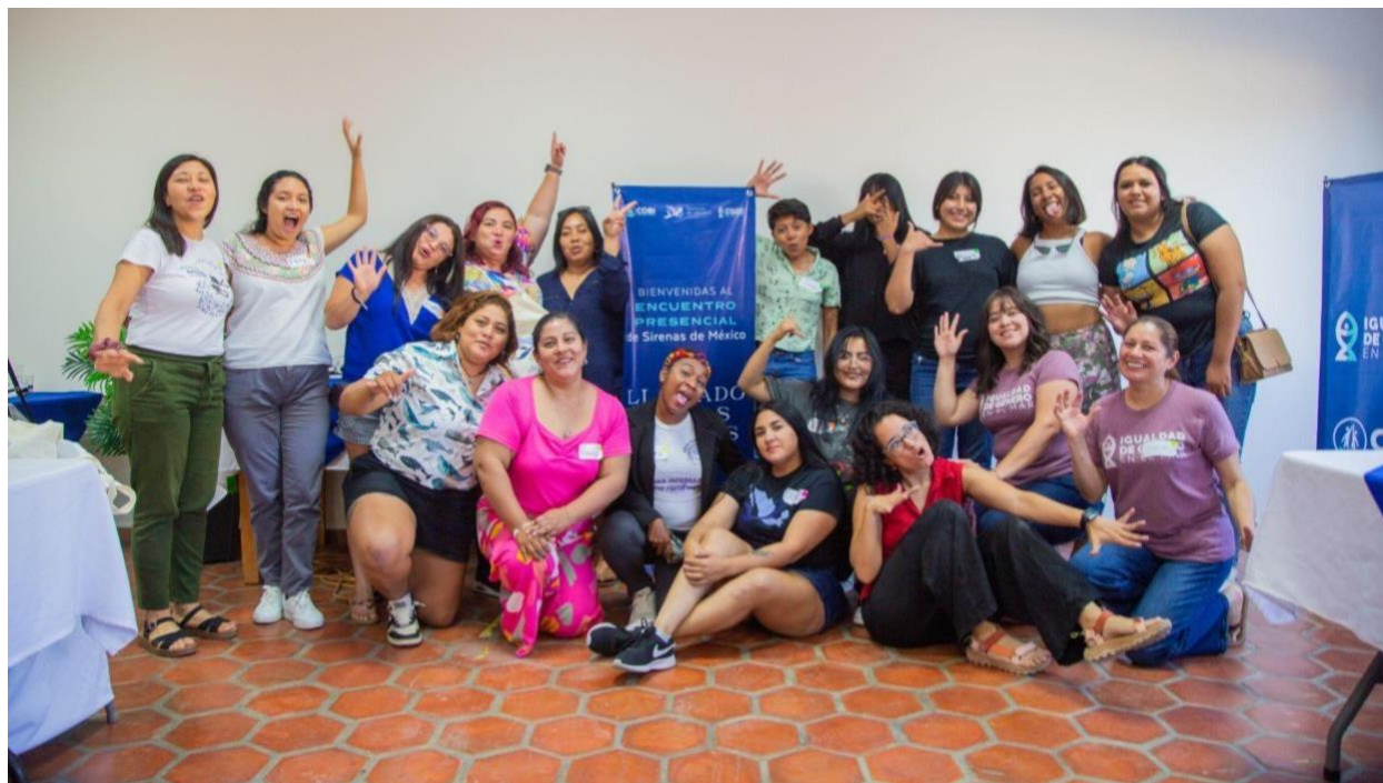
Figura 10. Participantes al término del primer día de taller

Al grupo coordinador de Sirenas de México por sus ideas, apoyo y retroalimentación en el diseño del taller.