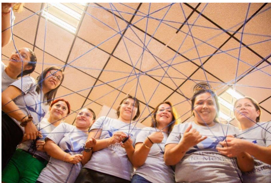
Figura 8. Sirenas de México durante su dinámica de cierre

Finalmente, se realizó una actividad de cierre para visibilizar los lazos tejidos entre las Sirenas de México a lo largo del taller, destacando lo que cada una se llevó de las demás y lo que les mantendrá conectadas a futuro. En este ejercicio, cada participante del taller compartió un mensaje a otra participante para agradecer o reconocer algo de la otra persona, con la cual se conectó o reconectó a través de este taller. Este ejercicio permitió realizar una despedida cercana y calurosa entre las Sirenas, buscando que las redes tejidas permanezcan en el tiempo y continúen teniéndose conexiones y acciones colectivas entre este grupo de hermanas del mar.