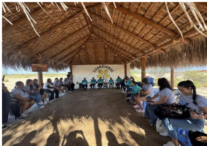
Figura 7. Visita al grupo Guardianas del Conchalito

El último día del encuentro, 16 de octubre, se tuvo una salida de campo para conectar con otras mujeres del mar a través de una visita al Estero El Conchalito, donde las Guardianas del Conchalito compartieron su experiencia de organización y conservación comunitaria. Las Guardianas compartieron los retos que enfrentaron en el pasado para iniciar y mantener su trabajo y organización colectiva, tanto en términos internos (ej. tensiones y conflictos, problemas de comunicación, retos de coordinación interna); como externos (ej. colaboración con otros actores, relación con la comunidad, relación con sus familias y tensiones que emergen por su trabajo de conservación).