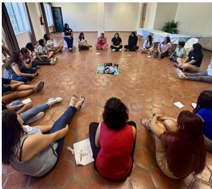
Figura 1. Sirenas de México durante círculo de escucha

Esta actividad permitió conocerse a un nivel más personal en cuanto a sus gustos, características e intereses personales y empezar a romper el hielo entre participantes.