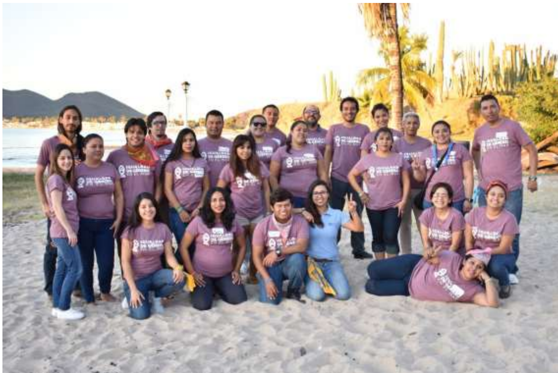
Ilustración 1 Fotografía de los participantes

A los líderes comunitarios y sus organizaciones, por darse el tiempo y espacio de compartir esta experiencia de la mano de COBI.