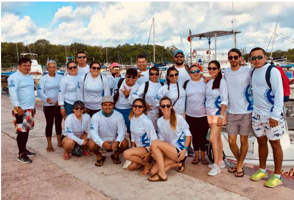
Figura 1 Fotografía de los participantes del taller

A cada uno de los líderes comunitarios y sus organizaciones, por darse el tiempo y espacio de compartir esta experiencia de la mano de COBI, además de comprometerse a mejorar la pesca y la conservación marina.